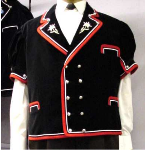
Samt Mutzli mit Edelweiss Stickerei