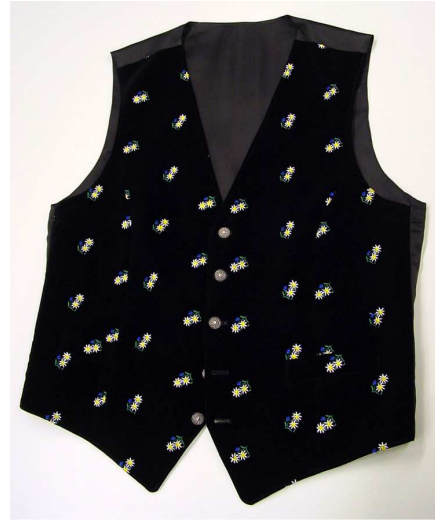
Gilet aus besticktem Samt